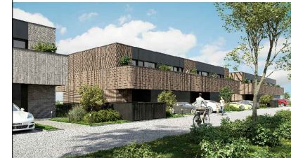
SCHEMAT INWESTYCJI- BUDYNEK D