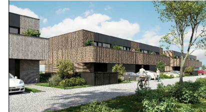
SCHEMAT INWESTYCJI- BUDYNEK D